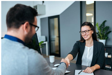
Zarządzanie zasobami ludzkimi