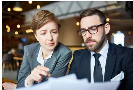
Zarządzanie strategiczne w kontekście prawnym, społecznym i finansowym