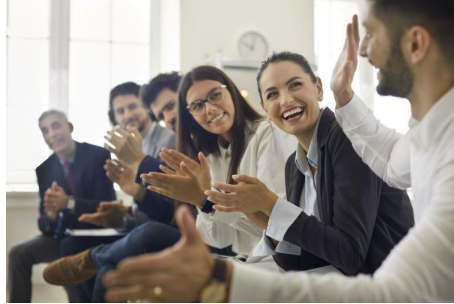
Przywództwo edukacyjne w szkole