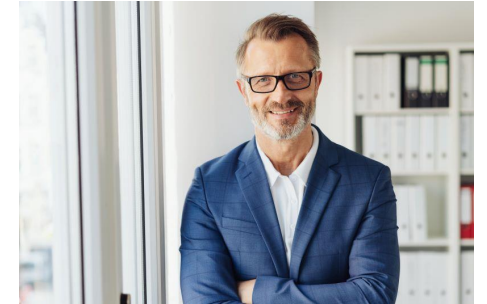
Polityka oświatowa – dyrektor jako lider w środowisku