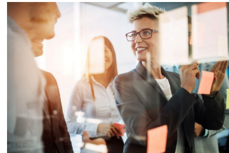
Zarządzanie własnym rozwojem zawodowym