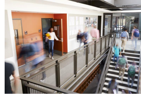
Wykorzystanie wybranych teorii i koncepcji pedagogicznych w planowaniu uczenia się oraz skuteczne metody opracowywania strategii nauczania